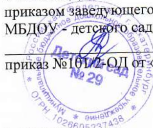
ГРАФИК РАБОТЫ, СМЕННОСТИ работников Муниципального бюджетного дошкольного образовательного учреждения - детского сада № 29