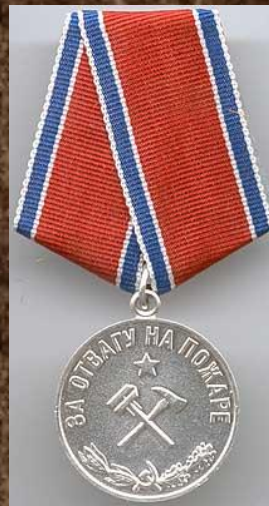
медаль «За отвагу на пожаре»