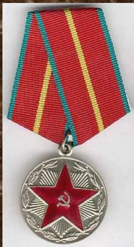
медаль «За безупречную службу» 1 степени