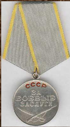
медаль «За боевые заслуги»