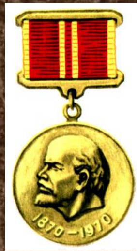
медаль «За доблестный труд»