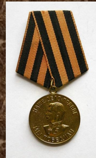
медаль «За победу над Германией в ВОВ 1941-1945 гг.»