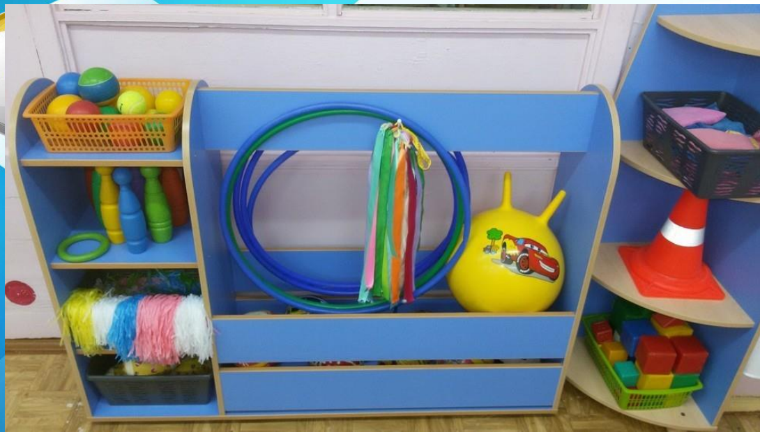
Физкультурный уголок младшей группы