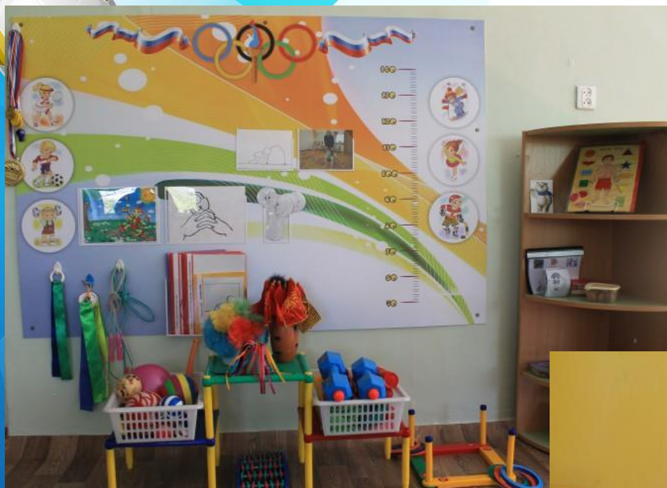
Физкультурный уголок старшей подготовительной группы